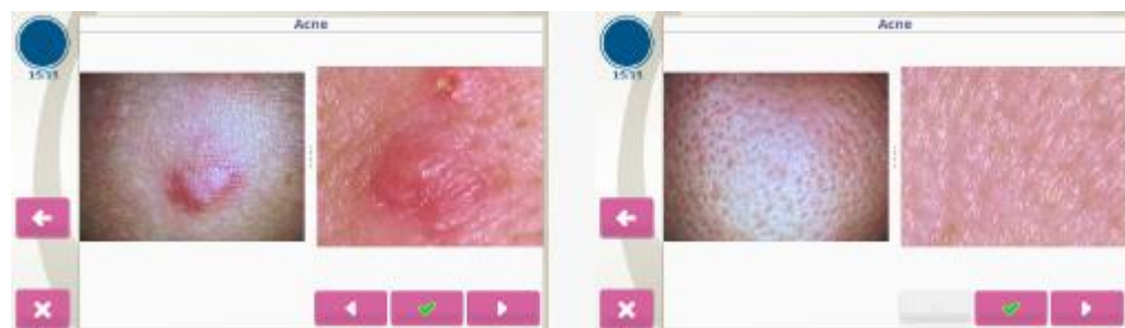
Inainte de tratament

O consultare inovatoare dramatică pentru evaluarea îmbătrânirii pielii. Include vârsta biologică a pielii, o evaluare detaliată a elasticității pielii, a hidratării, a nivelului de sebum, a petelor de pigmentare și a analizei ridurilor 3D. Esențiala pentru prevenirea și încetinirea semnelor de îmbătrânire.