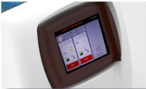
DISPLAY TOUCH SCREEN